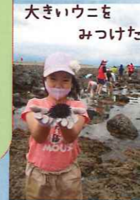
大きいウニを みつけた