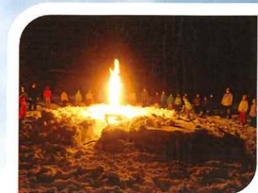
雪の中のキャンプファイヤー

スキーレベル別のレッスンなので、初心者も上級者も楽しくスキー 技術が向上します。 スキーレッスン以外にも、小学生以上は雪の中のキャンプファイヤー など、宿泊ならではの楽しいプログラムが盛りだくさん！