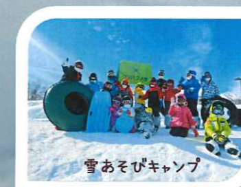
雪あそびキャンプ

雪の特性を生かして、数種類の雪遊びを体験し、とことん雪遊びを楽しむキャンプです。 1月5日(木)～7日(土) 妙高・雪遊びキャンプ(2泊) 年中～小3